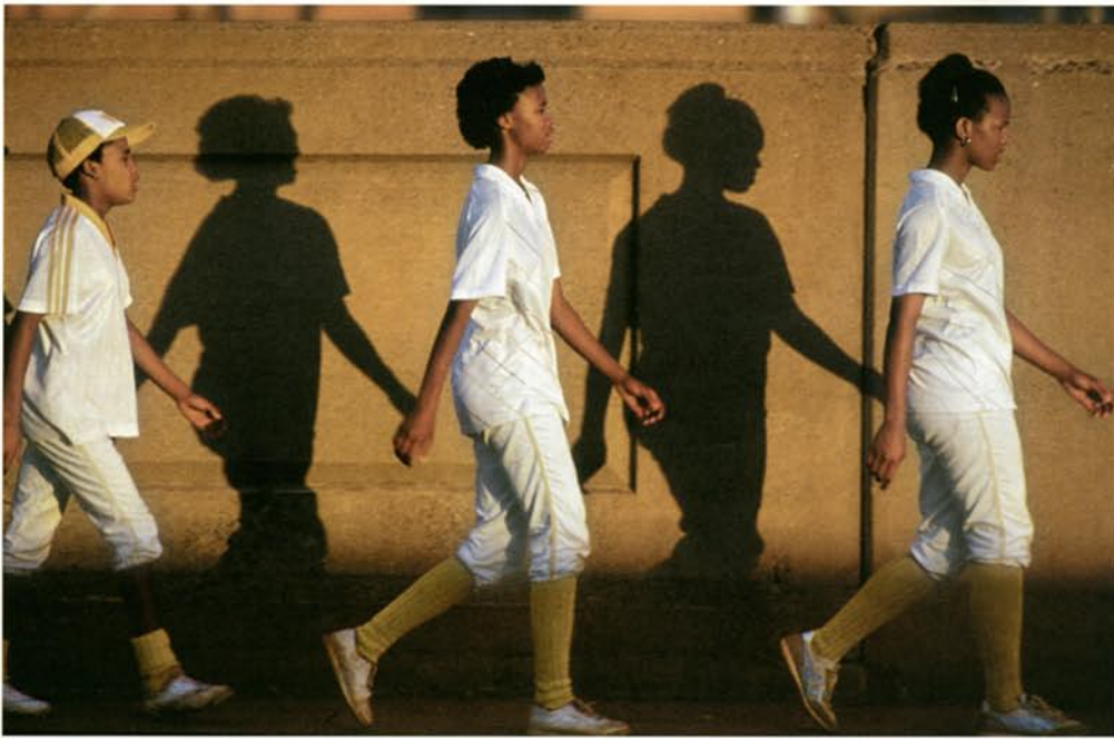
Sporters op weg in Johannesburg.

sen thuis. Het pontje over de Taag bleek ineens niet te varen, dus accepteerde ik maar dat ik vele kilometers om zou moeten rijden. En ineens was er een man met een roeiboot die aanbod mij met fiets en al over te zetten." "Pech krijg je nooit bij de voordeur. Onderweg is altijd wel een garage, fietsenmakers zijn dun gezaaid en meestal alleen in de steden.. Ik heb een set inbussleutels, spaken, een kettingpons en meer van dit soort dingen, bij elkaar een kilo. Ik heb onderhoudsvrije banden, dus ik hoef niet vaak te plakken. Meestal valt de pech mee en kun je onderweg repareren. Gaat het om ernstiger zaken dan wordt het liften of de bus nemen. Of een vrachtwagen afgeladen met mensen en een chauffeur die met een levensgevaarlijke snelheid reed. Onderweg werden er telkens mensen opgepikt, tenslotte