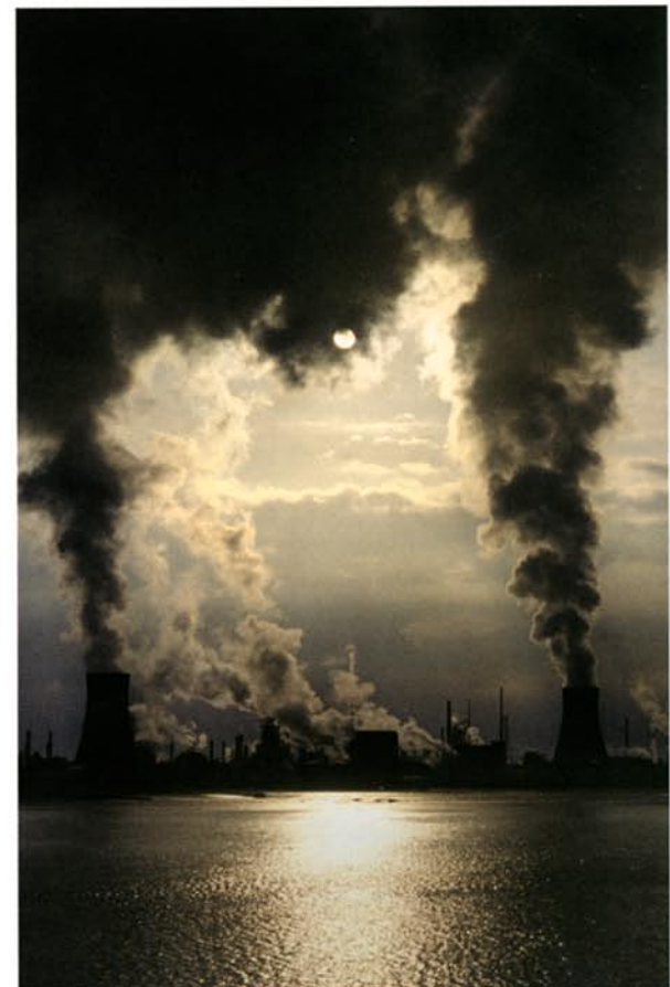
Rokende schoorstenen in Hull.