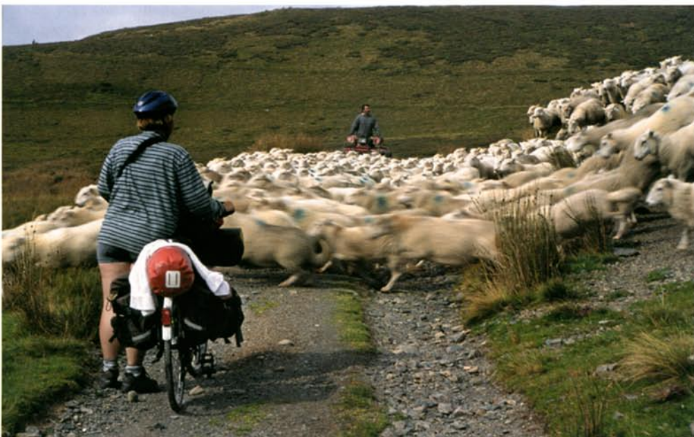
Schape op drift in de Cambrian Mountains, Wales.

zat iedereen boven op mijn fiets die onder in de laadbak lag, er was anders geen plaats meer. Een ander voorbeeld: een boutje van de drager was afgebroken. Ik kon het stukje dat in het frame zat niet loskrijgen, dus het werd improviseren met kabelbinders en een slangkleem. In een klein plaatsje verderop werd ik verwezen naar een technische school. Daar hadden ze waarschijnlijk nog nooit een fiets gezien, maar er werd onmiddellijk een praktijkles van gemaakt. Restanten boutje er uit gehaald, nieuw boutje gemaakt, monteren. Het hield een hele klas bezig. Geweldig toch? Wanneer je aanbiedt te betalen voor hulp is het vaak nee. Dan maak ik een paar portretten en biedt aan die op te sturen. Je krijgt dan een vaag kladje met een P.O.Box nummer in je hand gefruummeld. Ik stuur de foto's altijd op, maar of ze aankomen..."